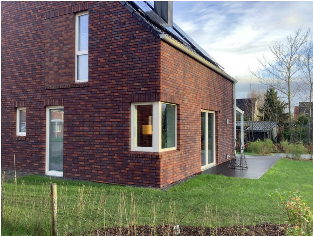
Domizil am Siel